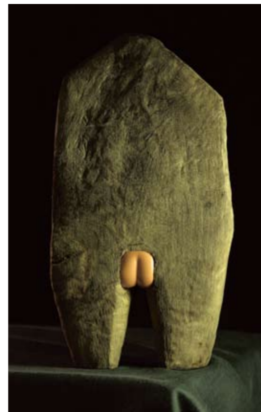
INUK SILIS HØEGH, Piitaa, Angutit (2003)

Move On er en samtalebog med en række mønsterbrydere, der på forbillig vis lever med deres personlige historier på godt og ondt. Hendes idé er at skabe modbilleder til tragikken, at