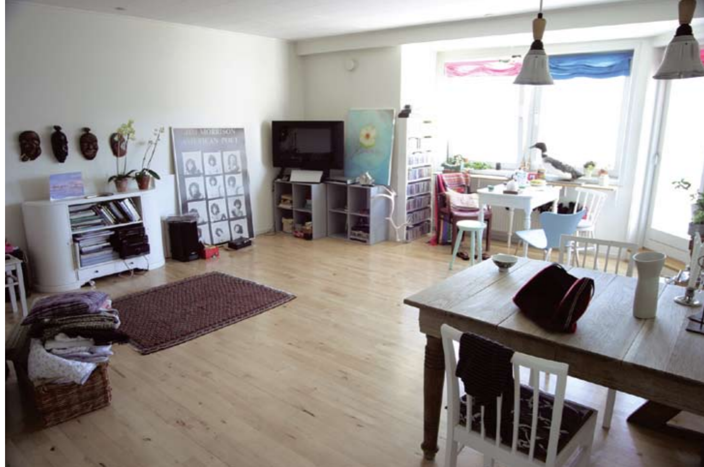
JULIE EDEL HARDENBERG, Interiør, Den stille mangfoldighed, Milik Publishing (2005)

(1894-1948) storladne naturskilderier, er den såkaldte nutidskunst (der altså ikke nødvendigvis er samtidskunst) repræsenteret med en overvægt af traditionelle værker (maleri, grafik og skulptur) med traditionelle motiver (natur, mytologi og menneske). For så vidt er indtrykket på nutidskunstområdet det samme som i Dronninglund; det har ikke noget med samtidskunst at gøre.