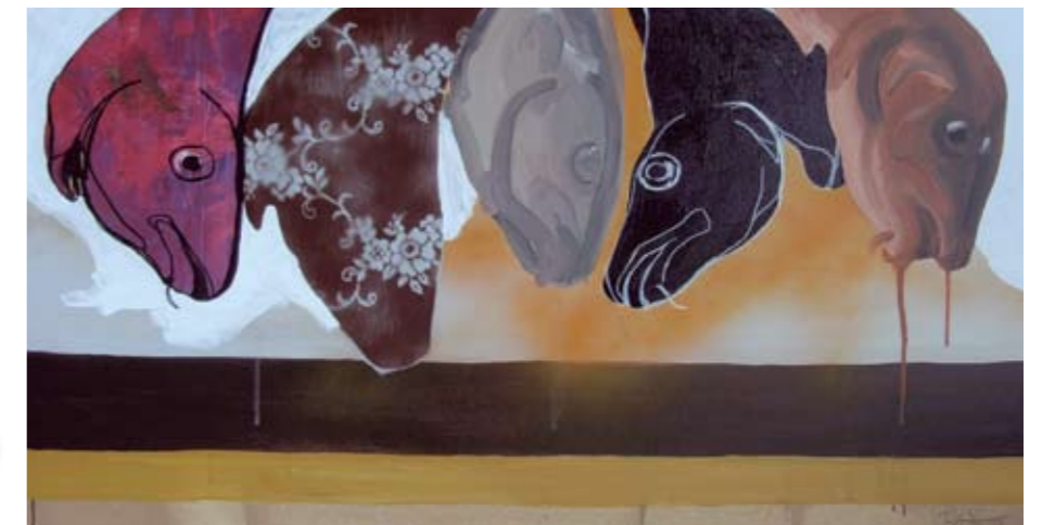
BOLATTA SILIS HØEGH, Torsk i Oahus, af acryl, touch og spray (2008)