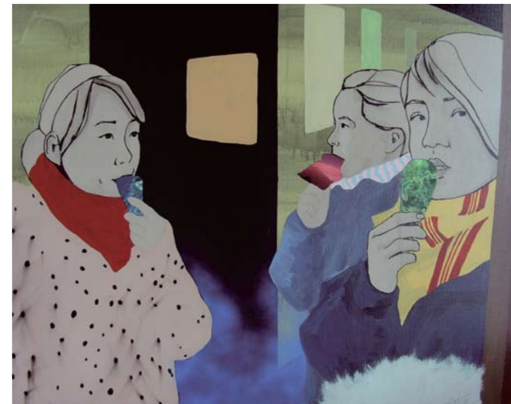
BOLATTA SILIS HØEGH, Is i Katuaq, acryl, tusch og spray (2008)